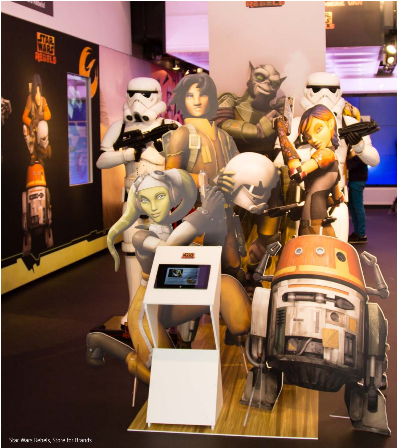
Star Wars Rebels, Store for Brands

Visual storytelling. Shoppers stappen een winkel binnen en worden meegevoerd in een verhaal.